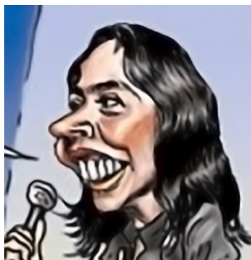
Figura 1: Fragmento de «Apanado»

Es aquí donde se hace hincapié en el rostro tipo roedor (fig. 1), puesto que el mismo Carlín relaciona este tipo de rostro con el de la ex primera dama Nadine Heredia. Este se caracteriza por poseer un maxilar inferior menos pronunciado que el promedio; además de dientes del maxilar superior bastante desarrollados. Se destaca la nariz, los labios y los dientes incisivos superiores: