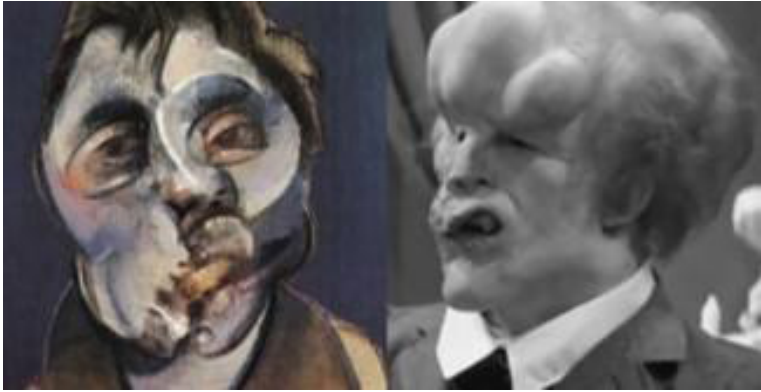
«Autorretrato» (1969) de Francis Bacon / El hombre elefante de David Lynch (1980)