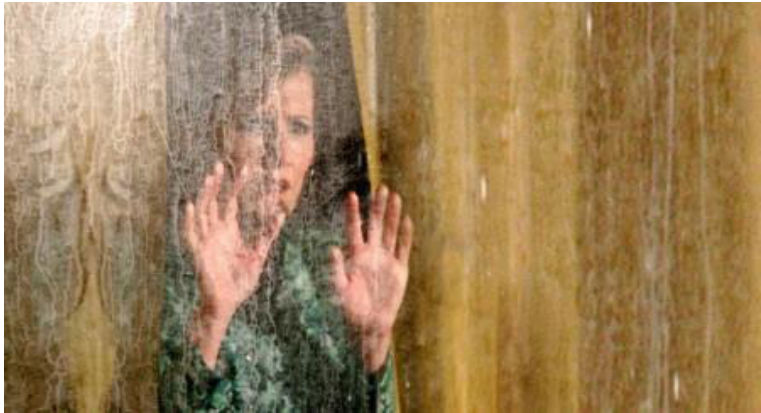
Nikki Grace Inland Empire (2006)