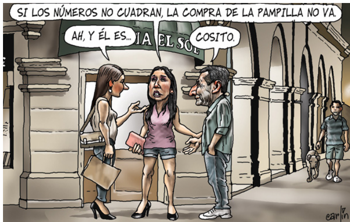
(Fig. 3) Carlinatura publicada el jueves 2 de mayo del 2013, p. 4. Recopilada en el libro de Carlín Hoja de Ruta (2013).