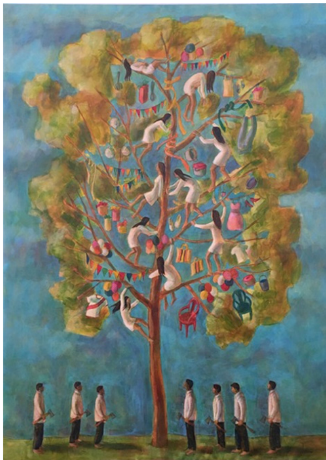
Yunza . Luz Letts (2018). Mixta sobre lienzo. 180 x 130 cm. Galería Fórum. https://galeriaforum.net/wp-content/uploads/2020/11/LuzLettsNro4LaYunzaw.png

Finalmente, cabe destacar que su obra también es un gran aporte para el arte feminista que se viene desarrollando en nuestro país, debido a que expone la situación que viene afrontando la mujer a través de los años en la sociedad limeña, mayoritariamente machista, a través de la simbolización de ella como objeto, la lucha por la emancipación femenina y la violencia de género.