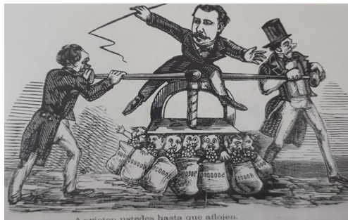
Fig. 3 «Aprieten ustedes hasta que aflojen» ordena Manuel Pardo según El Cascabel del 23 de noviembre de 1872. (Foto: Ramón Mujica).

No podemos pasar por alto tampoco el juego de significados con la palabra «prensa» que, a primera vista, se refiere a la máquina como tal. No obstante, una vez hecho el análisis cabe la posibilidad de que su intención subliminal haya sido referirse a la prensa periodística que apoyaba a Pardo y Lavalle.