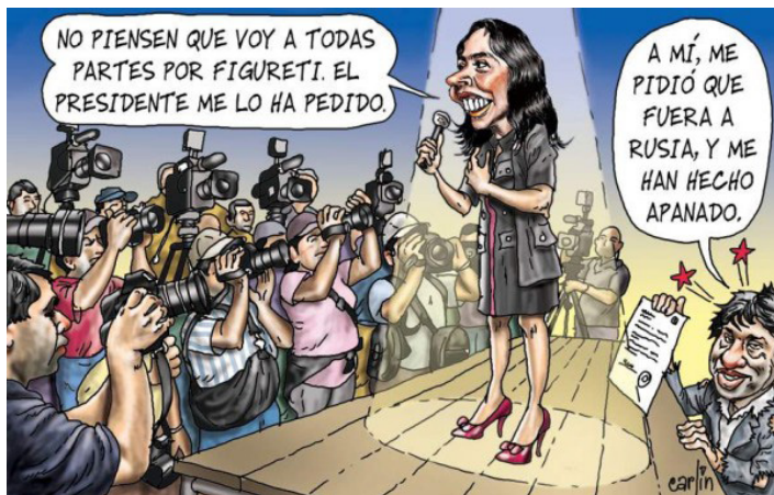
(Fig. 2) Carlinatura publicada el lunes 17 de septiembre del 2012, p. 4. Recopilada en el libro de Carlín Hoja de Ruta (2013).