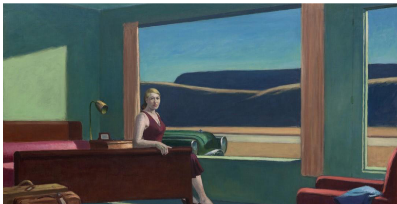
«Hotel del oeste» Edward Hopper (1957)