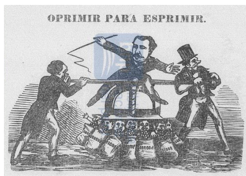
Fig. 2. Oprimir para esprimir. El Cascabel , 1873, N°175, p. 26

La caricatura se encuentra en formato apaisado, encabezada por el título que la describe: «Oprimir para esprimir». En el tercio central, se encuentra otro hombre sentado sobre una gran prensa y posee un látigo en su mano derecha. En el tercio izquierdo, se presenta un hombre empujando una de las palancas de dicha prensa en sentido horario. En el tercio derecho, observamos a otro hombre empujando la otra palanca que tiene la prensa, su rostro de perfil se ve con más claridad, a diferencia del anterior. Debajo de la prensa, se contabilizan a siete personajes comiendo de un costal un alimento de forma circular no identificable.