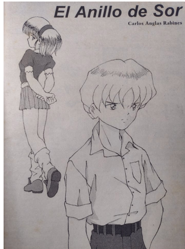
Carátula de El Anillo de Sor