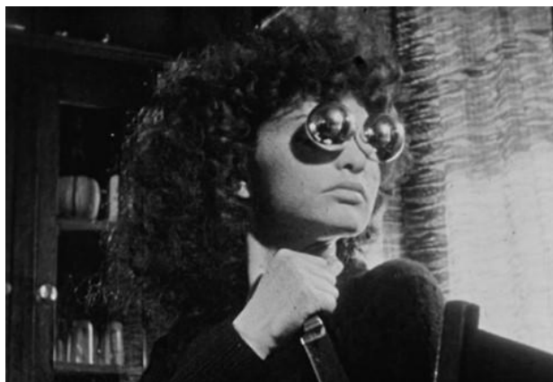
Maya Deren Un falso despertar (1943)