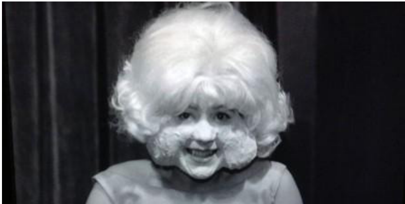
La mujer en el radiador Cabeza borradora (1977)