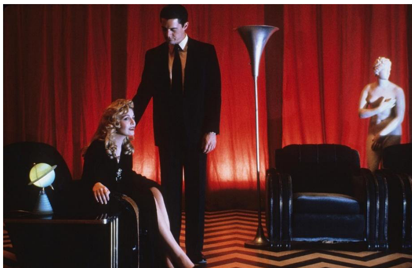
Laura Palmer Twin Peaks: Fuego camina conmigo (1992)